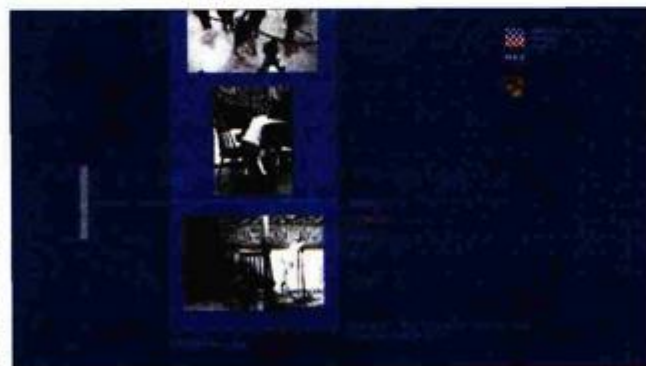
Detalj arhivskih stranica na DVD-u

ve slike i zvuke iz arhiva Muzičkog biennala i onog Hrvatske radiotelevizije, nudi kazala skladatelja i djela, praižvedbi, simpozija, predavanja, filmova, izložaba i izvođača. Nadalje,