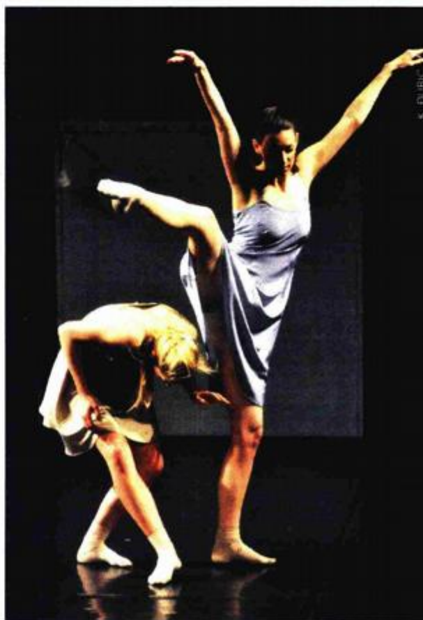
Jedan efektni baletni duet u predstavi „Zovem se Nitko“